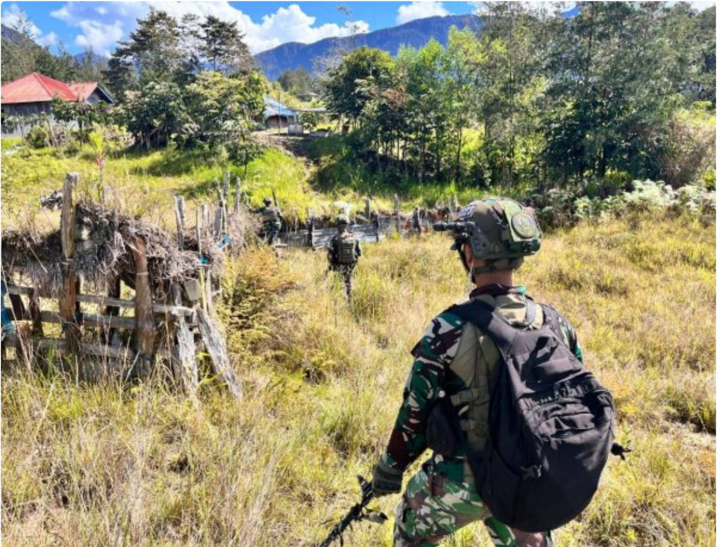
Satgas Mobile Yonif 323 Buaya Putih melaksanakan Patroli Komsos

Satgas Yonif 323 Buaya Putih Kostrad pada saat melaksanakan patroli menjaga